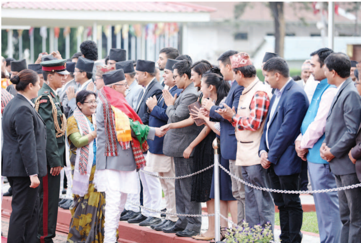
संयुक्त राष्ट्रसंघको ७३औं महाधिवेशनमा सहभागी भएर स्वदेश फर्कने क्रममा प्रधानमन्त्री केपी शर्मा ओलीलाई स्वागत गर्दै उहाँका समर्थक।