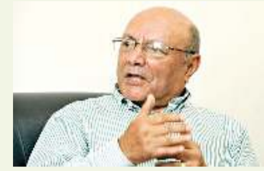
डा. भेषबहादुर थापा पूर्वपरराष्ट्रमन्त्री

नेपालकै अध्यक्षतामा भएको सम्मेलनमा क्षेत्रीय सहकार्यको महत्त्व र आपसी सहयोगका लागि तयार पारिएका कार्ययोजना कार्यान्वयनको पक्षमा प्राथमिकता भल्किएको छ। नेपालले गरेको तयारी, आधुनिकता, बहुपक्षीय सहमतिका विषय हेर्दा यसलाई सफल नै मान्नुपर्छ। अहिलेसम्म भएको गतिविधिले एउटा सही बाटो देखाएको छ, यो राम्रो लक्षण हो। तर, सार्क र बिमस्टेककै विगतलाई हेर्ने हो भने कार्यान्वयनमा हामी अग्रसर हुन सकेका छैनौं।