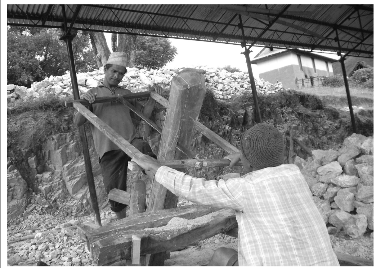
प्रविधिभन्दा टाढा : पछिल्लो समय कृषिलगायत उत्पादनका क्षेत्रमा आधुनिक प्रविधि र उपकरणहरूको प्रयोग बढे पनि परम्परागत रूपमा यसरी काठ चिर्ने काम गरिरहेका मानिसहरू गाउँघरमा भेटिनु नौलो कुरा होइन।

आश्रित वर्गहरूमा नै प्राकृतिक स्रोतमाथिको समान पहुँच पुग्न नसकेकाले त्यस्ता क्षेत्रका उपभोक्ताको जीवनयापनमा सहज नहुने वन विभागको भनाइ छ। वन विभागका अनुसार वनबाट प्राप्त भएको आम्दानी बाँडफाँटका विषयमा वित्तीय स्रोत आयोगले निर्णय गर्नेछ। विभागले सन् २०१० देखि २०१४ सम्म गरेको वनस्रोत सर्वेक्षणको तथ्यांकलाई आधार बनाएर स्थानीय तहमा कति वन रहेको आँकलन गरेको हो। वनको संघीय संरचना कस्तो रहने भन्ने विषयमा विवाद भइरहेका अधिकांशले सबै स्थानीय तहमा वनको समान पहुँच पुग्न नसकेको र प्राकृतिक स्रोतमाथि साफा अधिकार प्रत्याभूति गराउन प्रदेश तहमा नै वन रहन आवश्यक रहेको प्रतिक्रिया दिएका छन्। वन सरोकारवालाहरू सामुदायिक वनलाई स्थानीय तहमा राख्न माग गरेका छन्।